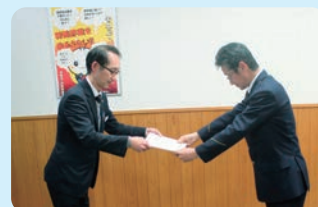
▲特殊詐欺被害の未然防止による感謝状授受

平成30年2月19日、適切な対応により特殊詐欺被害を未然に防止した職員に対し、滋賀県米原警察署より感謝状が授与されました。