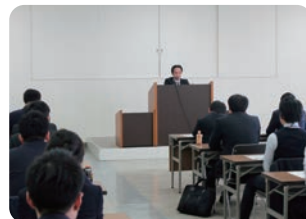
▲コンプライアンス研修会

今後ともお客さま本位の業務活動を推進し、大きな信用と信頼を得ることができるようコンプライアンス体制の更なる充実に取り組んでまいります。